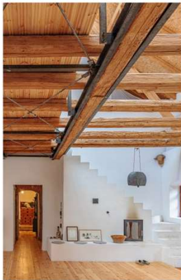
Wohnen im alten Stall